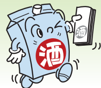
酒・アルミ付紙パック循環システムマーク