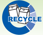
酒パック再生紙を使用しています