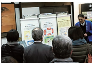
月桂冠 酒蔵まつり 2019年3月23日(土)