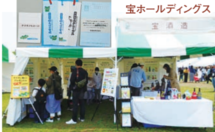
宝ホールディングス 宝酒造