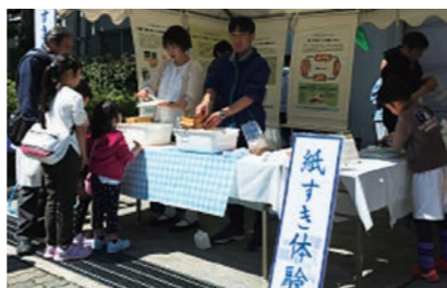
白鶴酒造 酒蔵開放 2019年4月13日(土)