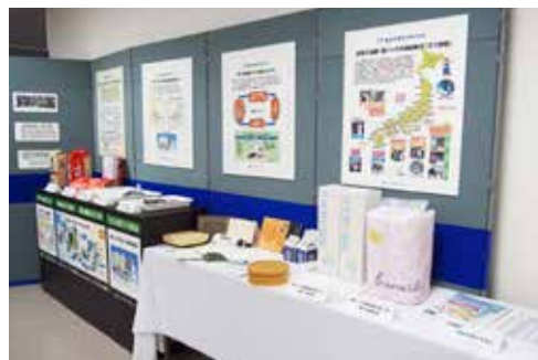
南但クリーンセンター常設展示 2階展示フロア-2月23日(火)より常設展示

ここ数年エコ酒屋の登録数は、479店舗のまま動かなかったが、今年初めに新たに4店舗の登録があり、登録店舗数が久しぶりに増加し483店舗となりました。しかし廃業店の数が増加し現在エコ酒屋数として公表している数より実数はさらに減少しているものと思われ