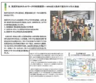
環境省のホームページ「Re-Style」

また個々のエコ酒屋の活動実態をつかむことが難しく、さらに新規登録店を地域的に拡大するための新たな方策が十分とていていないことが今後の課題と言えます。