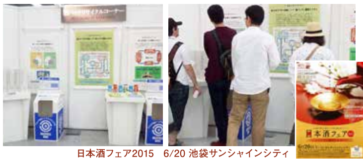
日本酒フェア2015 6/20 池袋サンシャインシティ

いずれのネットワークも固定した販売・回収先をもっていることから安定した数値が今後も期待できます。岐阜長野のそれぞれのネットワークに愛知の1作業所を加えた今年度実績は、回収量約170トン、販売量はトイレットペーパー3302ケースとなりました。 今年度は両ネットワークとそれぞれ意見交換する機会がはつくれましたが、これらの活動の経験交流会を開催するには至りませ