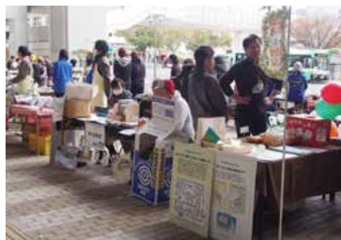
御影クラッセ販売イベントにて展示 3月25日(金)