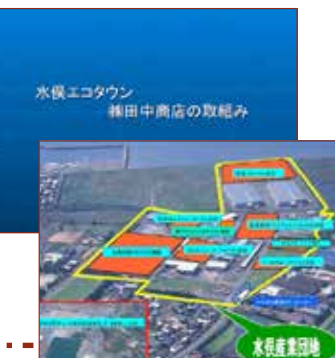
水俣エコタウン 株田中商店の取組み

田中商店では6R活動として、リフューズリデュースリメイクリペアリユースリサイクルの取り組みを行っています。環境省の循環型社会形成実証事業として平成15・16年には、本来のびん商としての活動である南九州にお