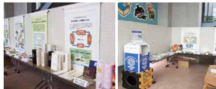
こうべ環境未来館「エコ+」企画展 7/23~8/15