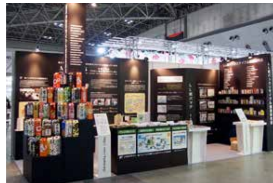
東京ビッグサイト エコプロダクツ2015 12月10日(木)~12日(土)開催3日間の総来場者数 169,118人

かけ、酒パックリサイクルの常設展示を実現し、芦屋小売酒販組合が、日頃から支援している地域の福祉作業所の元を福祉作業所の販売イベントに協力展示をするなど、各地で地域に密着した環境と福祉に貢献する「エコ酒屋」を実践しています。 また今年度も例年通り東京ビッグサイトで開催のエコプロダクツ展に、アルミ付紙パックリサイクルの啓発に努めました。